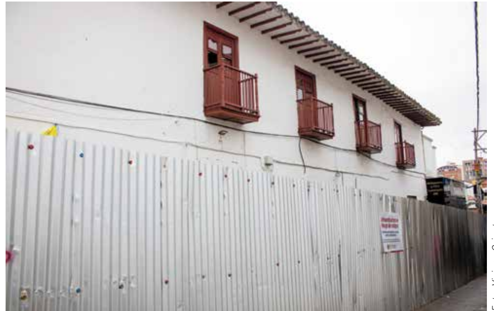
La Maestranza fue escuela de ingeniería militar y taller de armas durante la Independencia. Su recuperación sigue pendiente del avance en la cubierta y de futuras decisiones del municipio.