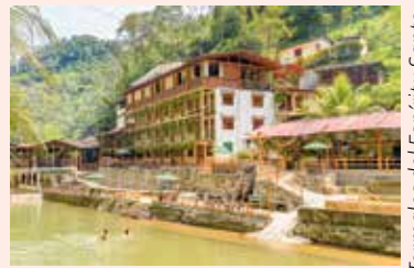
Foto: eco-hotel Los Termales del Espíritu Santo.

Más información: consulte los horarios y planes en https://termalesespiritusanto.co/