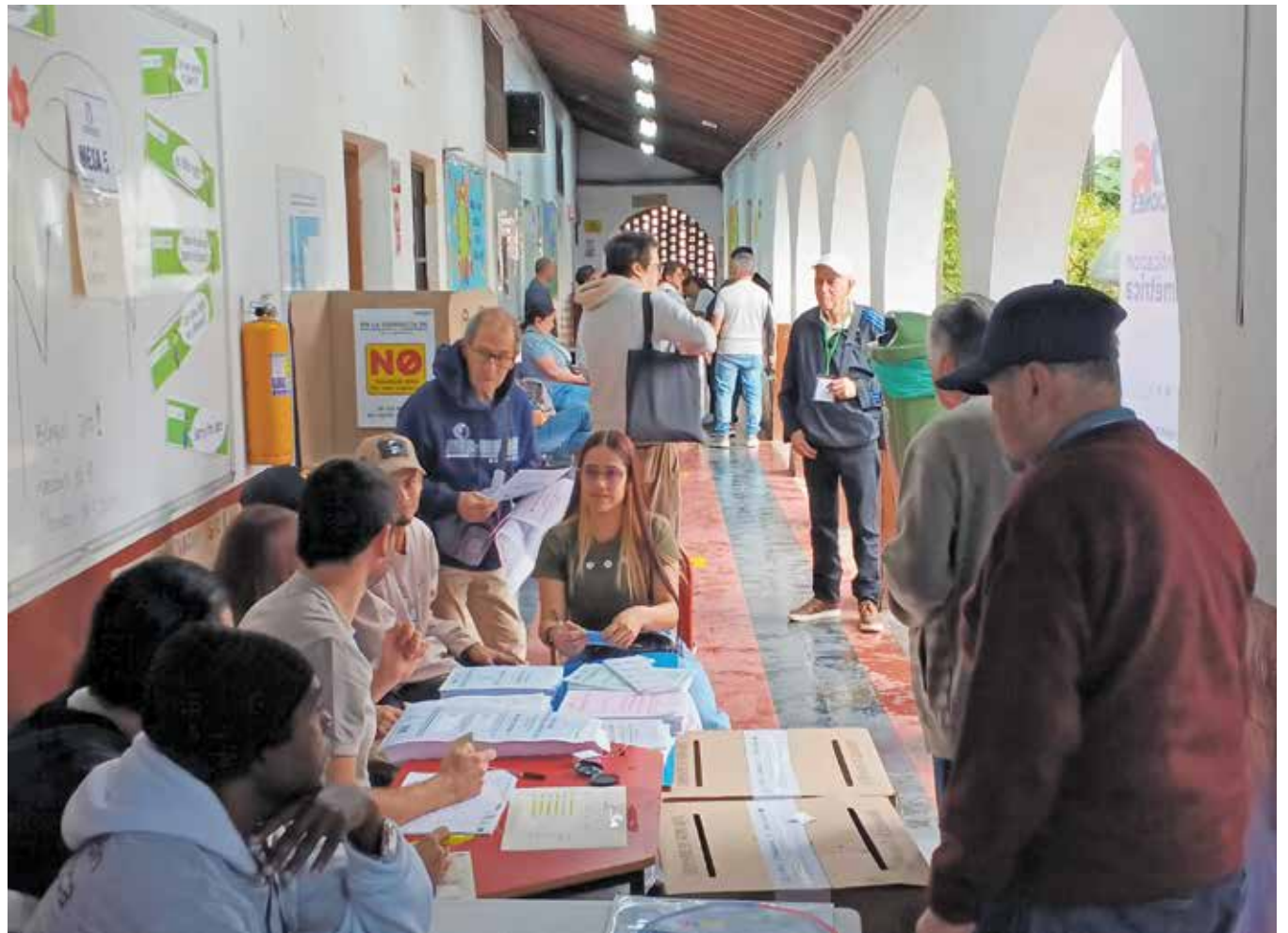
Según los promotores de la iniciativa, la unificación de las fechas no modifica el contenido de las consultas ni los requisitos para su aprobación. Se busca concentrar la organización electoral en una sola jornada para reducir costos operativos.

La unificación de las fechas no modifica el contenido de las consultas ni los requisitos para su aprobación.