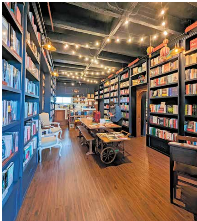
Cotidiana funciona en el Mall Media Luna, cerca del parque municipal de El Retiro. Además de su variedad de títulos, ofrece conversatorios, talleres y clubes de lectura cada mes.