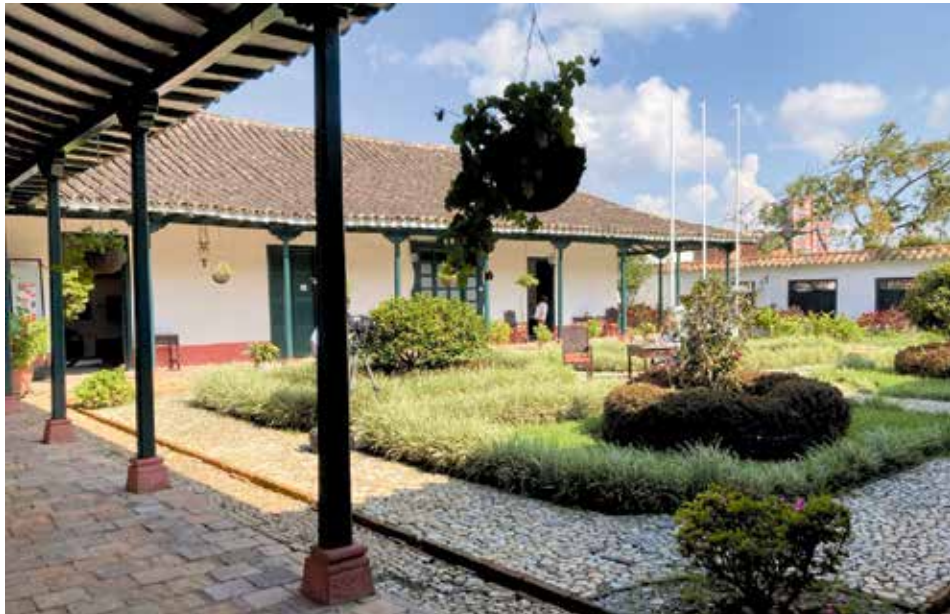
La Casa de la Convención conserva piezas asociadas a la firma de la Constitución de 1863 y un archivo histórico clave para estudiar la memoria política y documental del Oriente antioqueño.