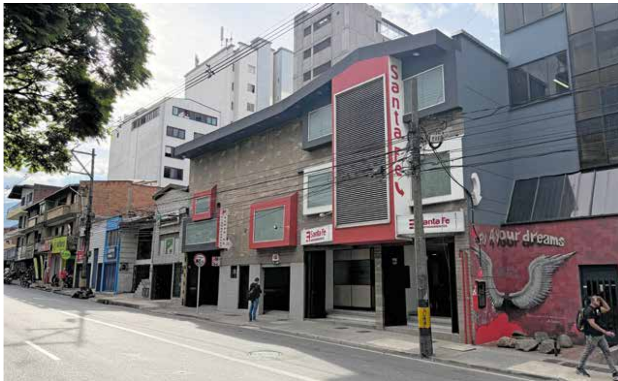
La empresa mantiene una dinámica de crecimiento inspirada en los valores y principios que guían la labor de las más de 200 personas que hoy hacen parte de ella, brindando tradición, confianza y respaldo a los clientes.

A los servicios que tradicionalmente ha brindado Arrendamientos Santa Fe, hoy se añade también el de avalúos de bienes inmuebles. “Somos miembros de la Lonja de Medellín y del Registro Nacional de Avaluadores, que es un requisito indispensable para desarrollar esta actividad, pues se necesita el registro para poder entregar avalúos certificados”, dice Corrales.