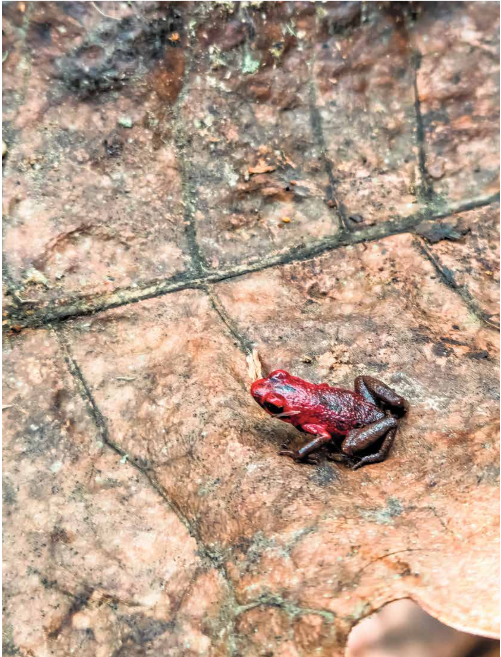
FOTO: Ranita dardo roja, en la reserva natural privada Lagos de Jasú, zona rural de San Vicente Ferrer.

Ejemplar impreso en papel proveniente de fuentes renovables, es biodegradable y reciclable. Con tintas a base de aceite de soya.