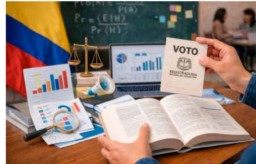
La polarización convierte el desacuerdo en identidades cerradas y vuelve más difícil la corrección pública de errores, afectando la capacidad de aprender colectivamente.