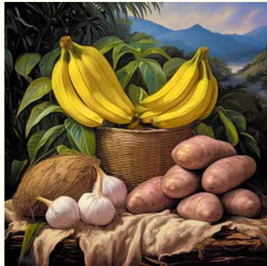
Las Musáceas y tubérculos también son conocidos como frutos feculentos porque son ricos en fécula, un producto del almidón.