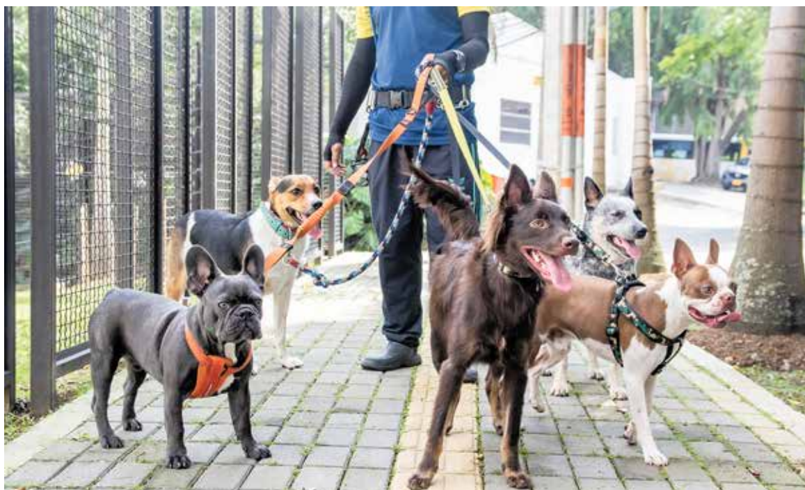
En municipios como Envigado, hay equipos especializados que trabajan con rigor en temas de cuidado animal. Las personas que necesiten asesoría o quieran reportar cualquier situación, pueden comunicarse con la línea 6043394170. Atienden de lunes a viernes de 7 a.m. a 5 p.m.

Dice que aquí también es importante incluir el tema de la esterilización: “Es una de las partes centrales en el tema de tenencia de mascotas, si se tiene en cuenta que hay sobrepoblación de animales y cientos que viven en las calles y necesitan ser adoptados. Un control de natalidad disminuye estas cifras y evita la propagación de enfermedades, principalmente en hembras”.