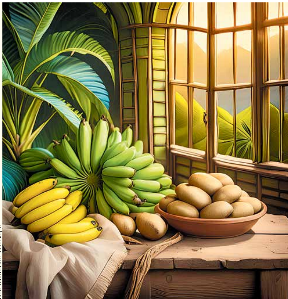
Ilustraciones IA: Adobe Firefly.

Además de su importancia culinaria, las musáceas y los tubérculos también tienen una gran importancia cultural en Colombia. Estos alimentos se han cultivado y consumido en el país durante siglos, y forman parte de la identidad nacional colombiana.