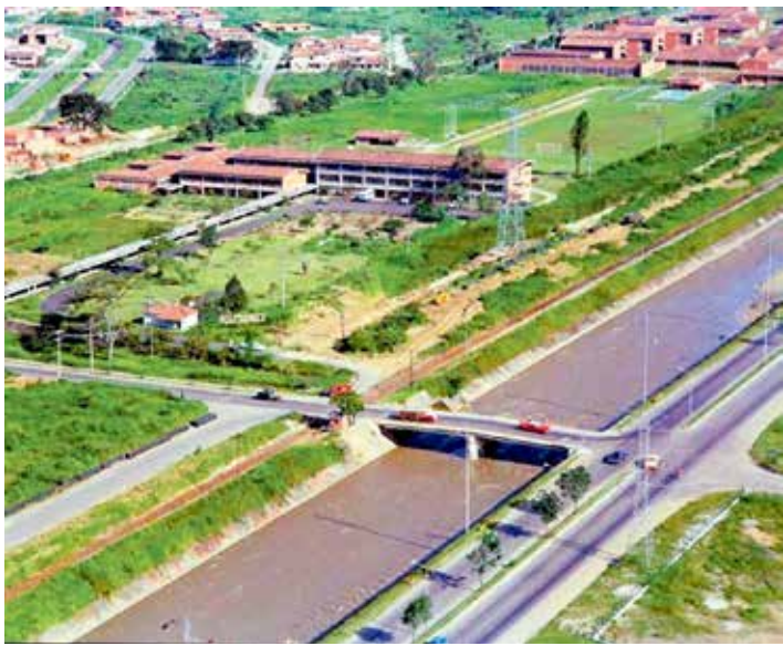
El Politécnico nació en El Poblado antes de la ampliación de Las Vegas y la consolidación de los barrios Patio Bonito y Manila; muy cerca de la otrora estación del tren, en cuyo lote se construiría, mucho después, el centro comercial Monterrey.