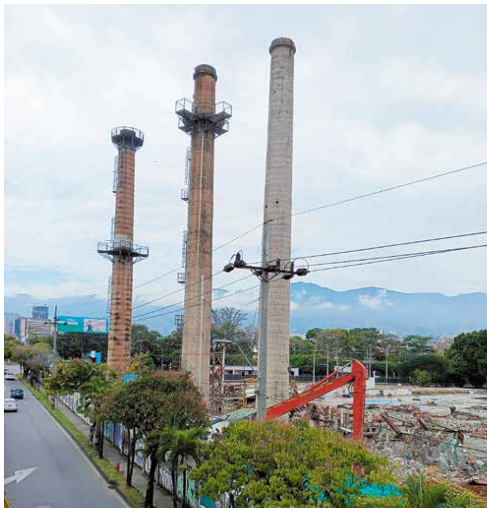
El 18 de abril, Planeación Envigado respaldó un estudio independiente sobre el estado estructural de las tres chimeneas, de 43 metros cada una, el cual recomendó la conservación de dos de ellas. Dicho concepto técnico abrió el camino para su futuro uso cultural y social.