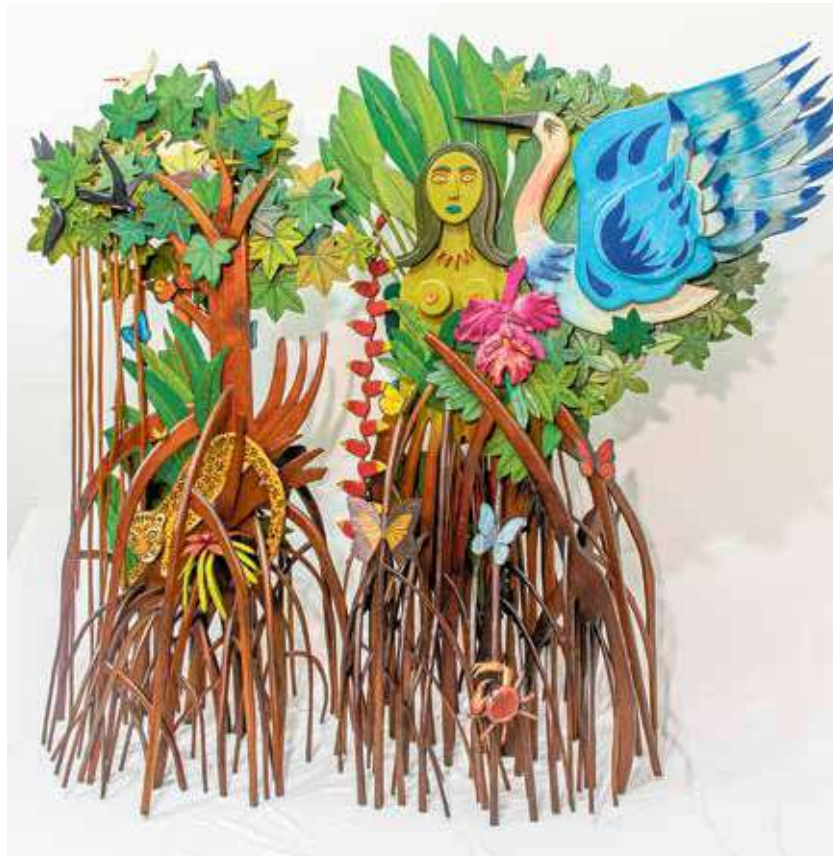
Hasta el 1° de septiembre estará abierta la exposición Hernando Tejada: Viaje de vuelta , que recoge las obras que la familia del artista pereirano donó al Museo de Arte Moderno de Medellín. Una maravillosa forma de conmemorar los 100 años del nacimiento de este gran artista, que murió en 1998.

Quizá lo primero que esta obra produce en nosotros es una alegre sensación de gozo y de simpatía. Nos